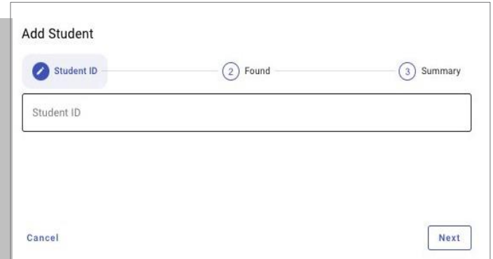
आफ्नो विद्यार्थी खोज्नुहोस्