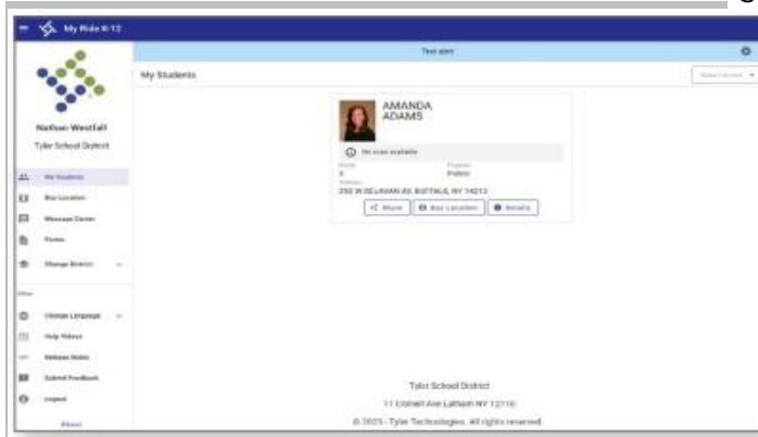
My Ride K-12 Dashboard